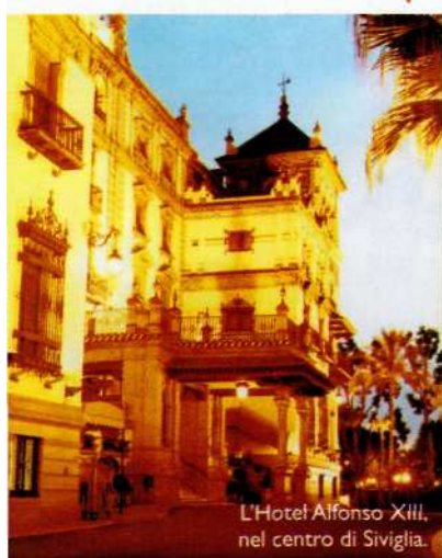
L'Hotel Alfonso XIII, nel centro di Siviglia.

pernottare al lago di Ifni, oppure prendervi altri due giorni per salire in cima allo Jbel Angour. I sentieri sono poco frequentati e le escursioni non sono difficilissime, nemmeno dal punto di vista tecnico, ma servono buoni scarponi e un abbigliamento pesante: di notte può fare molto freddo. La vostra guida noleggerà un mulo per trasportare i bagagli. Per il ritorno prenotate alla Kasbah DuToubkal di Imlil, che ha camere con veranda affacciata sulle vette e un hammam per liberarsi della fatica. Le guide dell'hotel organizzano facili escursioni o trekking di più giorni sulle montagne circostanti (tei. +212 24 485611, www.kasbahdutoubkal.com ; doppia 160 €). Non lontano, nella fertile vallata dello Nfis, c'è il Domaine de La Roseraie . Ha giardini pieni di roseti, diverse piscine ed eccezionali cavalli arabi-berberi, perfetti per esplorare le colline e i villaggi vicini (Taroudant Road km 60 per Marrakech, Ouirgane Valley, tei. +212 24 485694, www.laroseraiehotel.com ; doppia 125 €; cavalli per equitazione 62 € al giorno).